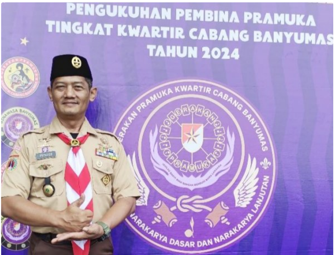
Kapenrem 071/Wijaya Kusuma dikukuhkan sebagai Pembina Pramuka Kwartcab Banyumas

BANYUMAS - Kapenrem 071/Wijaya Kusuma Kodam IV/Diponegoro, Kapten